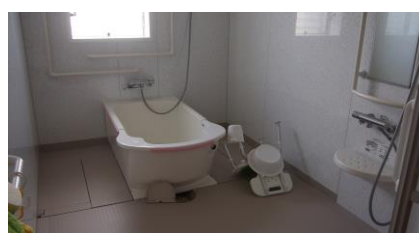
重介護者用お風呂