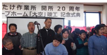
竣工式（オープニングセレモニー）