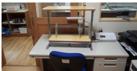
机上棚・事務机・椅子