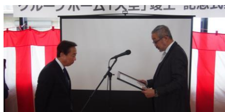
竣工式（感謝状贈呈）